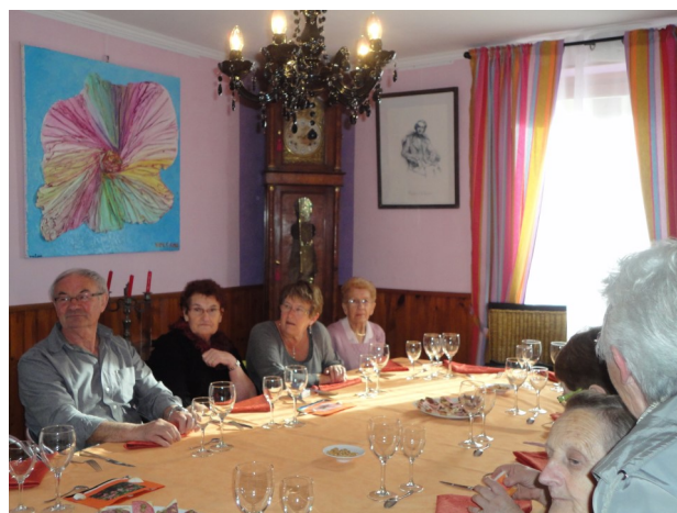
2013 Repas des aînés

Et vous tous prenez bien soin de vous et sortez masqué afin que nous puissions reprendre nombreux nos chaleureux après midi du jeudi.