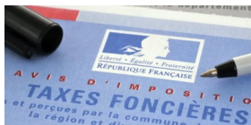
Schéma explicatif du changement de taux sur la taxe foncière